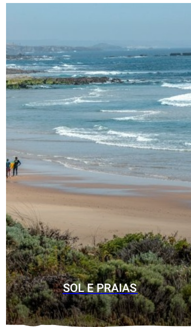
SOL E PRAIAS