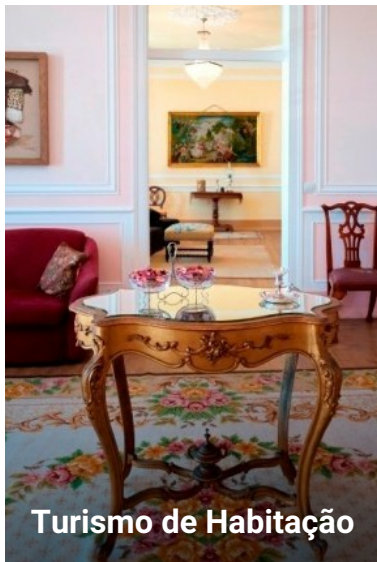
Turismo de Habitação