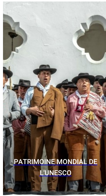
PATRIMOINE MONDIAL DE L'UNESCO