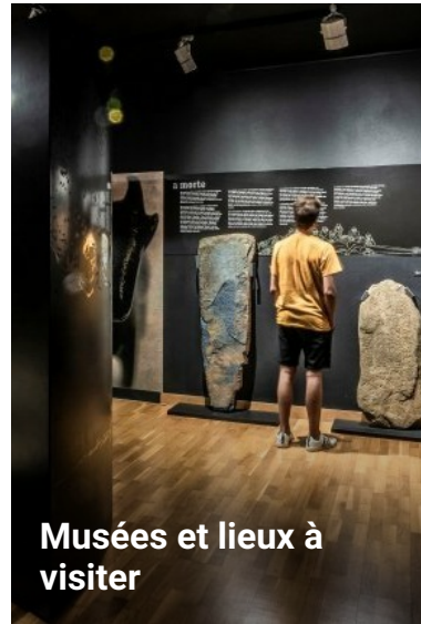
Musées et lieux à visiter