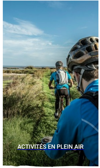
ACTIVITÉS EN PLEIN AIR