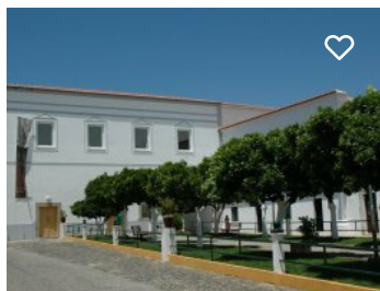
Casa do Arco