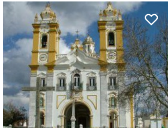
Santuário de Nossa Senhora d' Aires