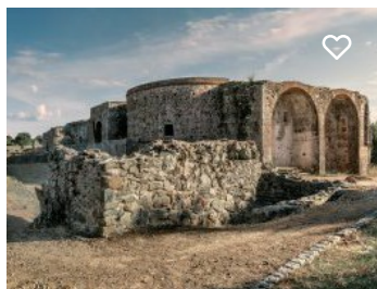
Sítio arqueológico de S. Cucufate