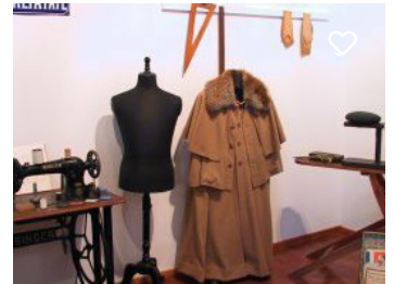
Museu Municipal de Vidigueira