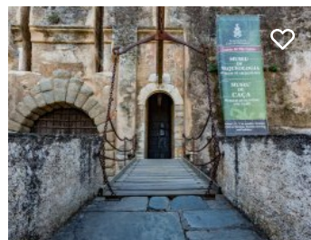
Castelo de Vila Viçosa