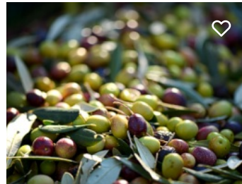
Clube Galega - Centro Interpretativo da Azeitona e do Azeite