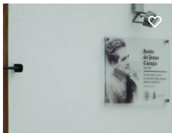
Casa Museu Bento de Jesus Caraça