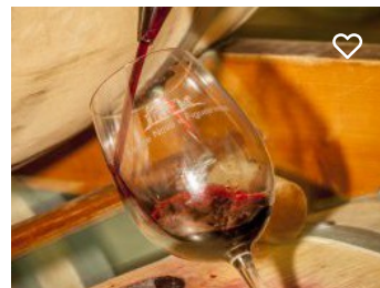
Herdade da Figueirinha