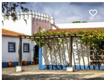
Monte do Pintor