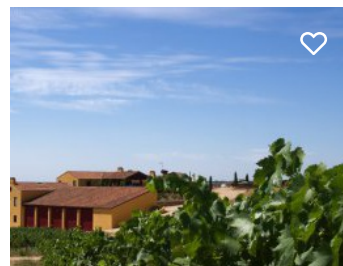
Adega Valle de Junco