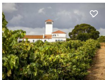
Herdade da Arcebispa