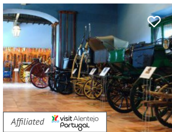
Monte da Ravasqueira