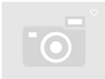
Herdade Fontes Paredes