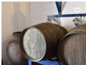
Fundação Abreu Callado