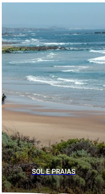
SOL E PRAIAS