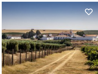
Herdade do Pinheiro