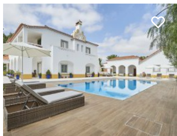
Herdade da Calada