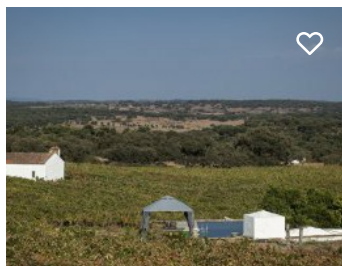
Herdade das Cortiçadas