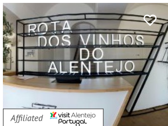
Rota dos Vinhos do Alentejo