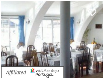
Restaurante A Escola