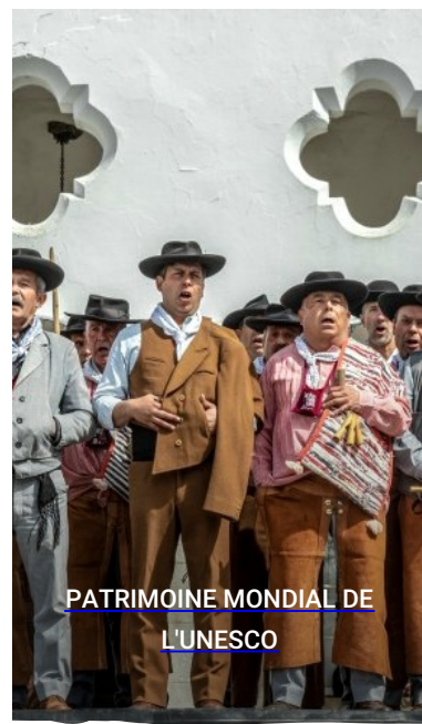
PATRIMOINE MONDIAL DE L'UNESCO