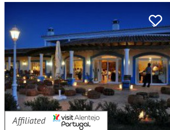
Restaurante Herdade dos Grous