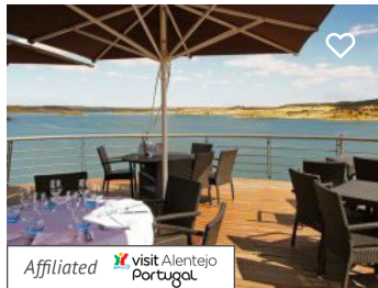
Restaurante Panoramico da Amieira Marina