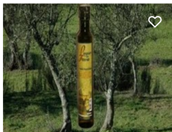
Lagar do Fava