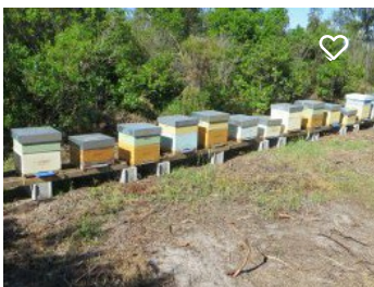
Olimel - Azeite e Mel, Lda