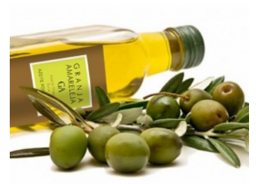
Cooperativa Agrícola de Granja Amareleja

Ferreira Do Alentejo - Voir sur la carte