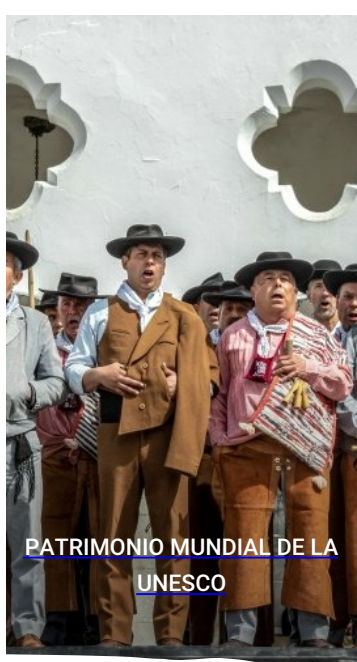
PATRIMONIO MUNDIAL DE LA UNESCO