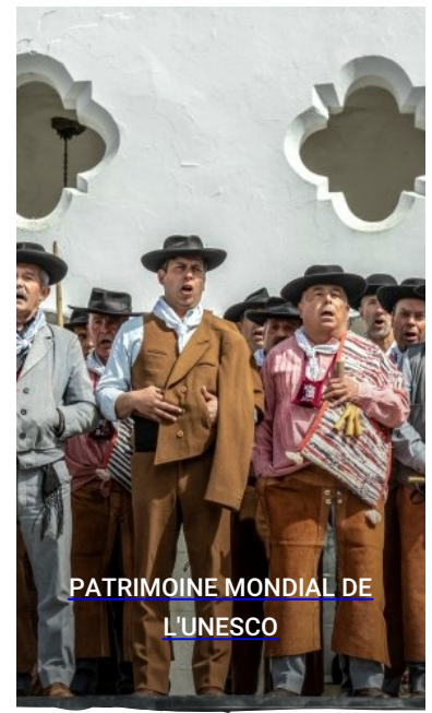
PATRIMOINE MONDIAL DE L'UNESCO