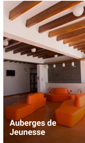
Auberges de Jeunesse