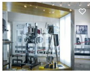
Museu Municipal da Fotografia João Carpinteiro