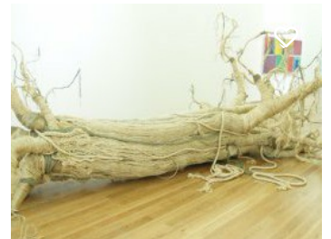
Museu de Arte Contemporânea de Elvas (MACE)