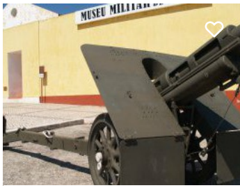
Museu Militar de Elvas