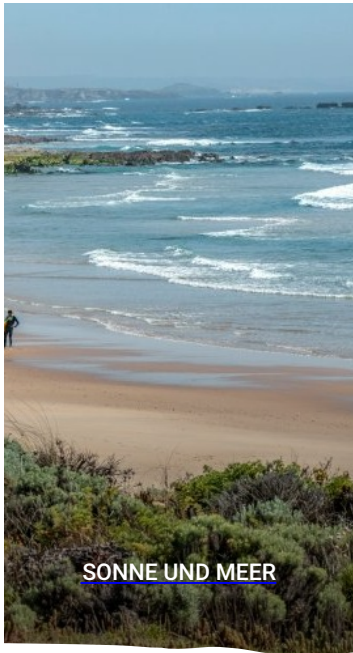
SONNE UND MEER