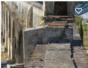
Aqueduto da Amoreira