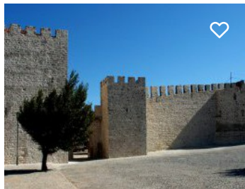
Castelo de Elvas