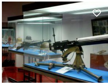
Museu Militar Forte de Santa Luzia