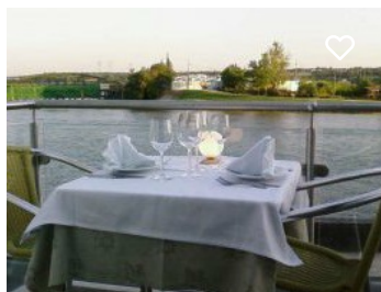
Restaurante O Brasão