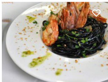
Restaurante Sabores da Vila