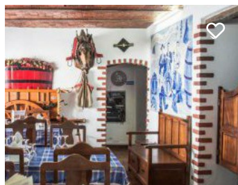
Adega dos Ramalhos