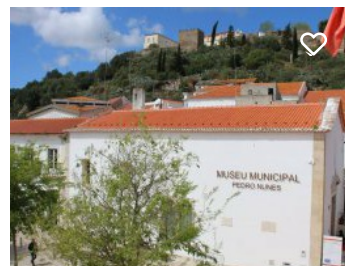
Museu Municipal Pedro Nunes