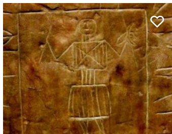
Museu da Escrita do Sudoeste Almodôvar (MESA)