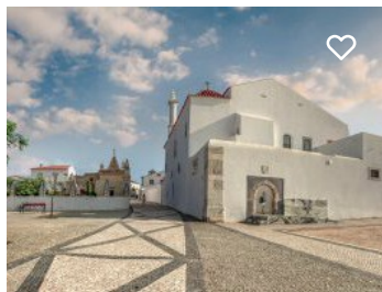
Paço dos Henriques