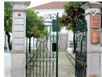
Museu Municipal de Aljustrel | Núcleo de Arqueologia