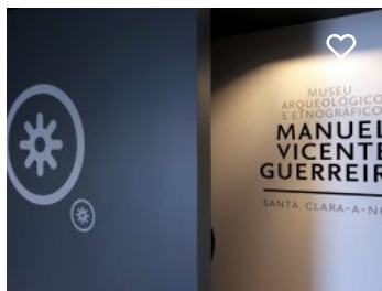
Museu Arqueológico e Etnográfico Manuel Vicente Guerreiro