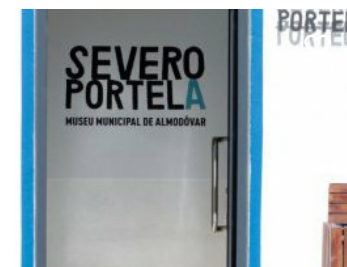
Museu Municipal Severo Portela