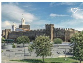
Castelo de Alandroal