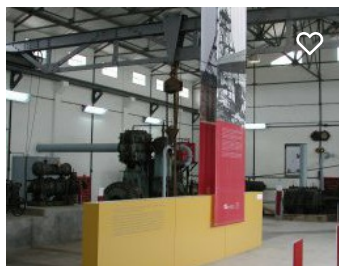
Museu Municipal de Aljustrel | Núcleo da Central de Compressores de Algarés