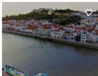
Castelo de Alcácer do Sal e Cripta Arqueológica