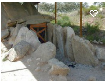
Anta Grande do zambujeiro