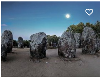
Cromeleque dos Almendres