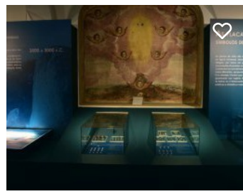
Megalithica Eboracensis Centro Interpretativo do Convento dos Remédios