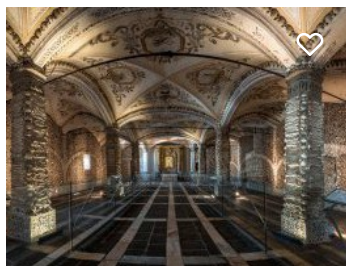
Capela dos Ossos da Igreja de S. Francisco