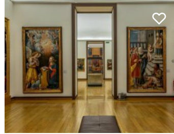
Museu de Évora