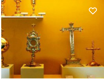
Museu de Arte Sacra da Sé de Évora