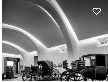
Museu de Carruagens