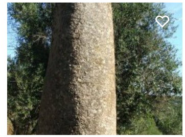
Menir dos Almendres