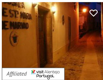
Pousada de Marvão