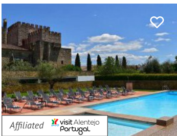
Pousada do Crato