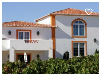
Monte Seis Reis