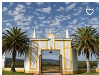
Quinta do Carmo