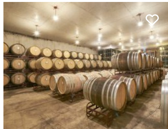
Adegas do Monte Branco