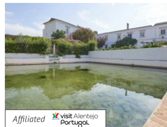
Quinta do Mouro