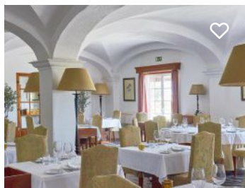
Herdade das Servas