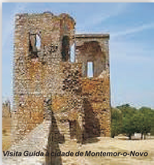
Visita Guia à cidade de Montemor-o-Novo

Inicialmente localizada dentro das muralhas do castelo, a vila de Montemor expandiu pela encosta Norte, onde actualmente se localiza. Começando no antigo Rossio da cidade, passando pela antiga Rua Nova e pela antiga Rua Direita, esta tour traz à luz dos nossos dias a vida e as dinâmicas do Arrabalde da antiga vila. Em Montemor-o-Novo pode-se visitar um vasto conjunto de igrejas, conventos, fontes e habitações de traçado manuelino que passam facilmente despercebidos sob as rotinas do quotidiano. Teve ainda um papel importante no desenrolar de acontecimentos históricos como a resistência à primeira invasão francesa e guerra civil portuguesa e viu nascer São João de Deus e Belchior Curvo Semedo. Pontos-chave da Tour – Rua de Avis, Rua Nova; Chafariz da Rua Nova; Lápide Romana; Chafariz da Fonte de Nossa Senhora da Conceição e Chafariz do Besugo; Rua Direita; Igreja da Misericórdia; Largo S. João de Deus; Cine-Teatro Curvo Semedo; e Igreja do Calvário.