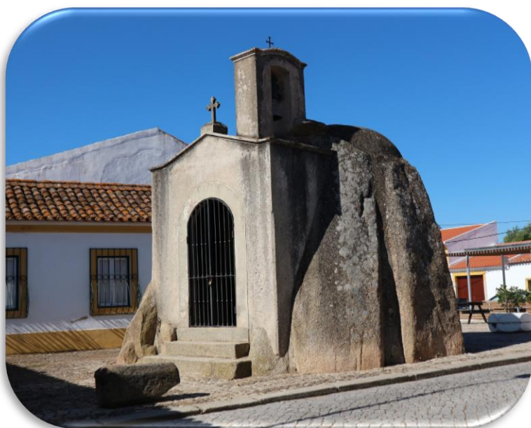
Anta de Pavia e Capela de S. Dinis - Mora